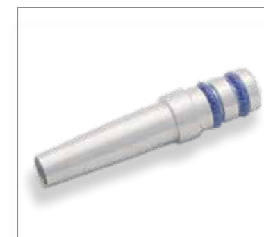
5 Артикул 444.0013.1