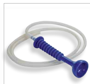
5 Артикул 404.0194.0