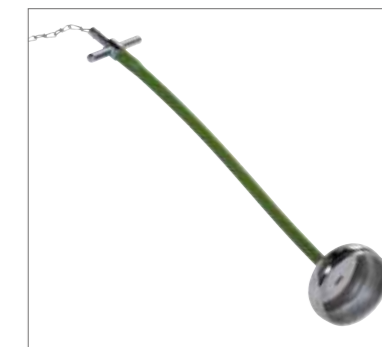
4 Артикул 404.0157.0