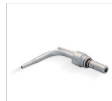
4 Артикул 444.0012.0