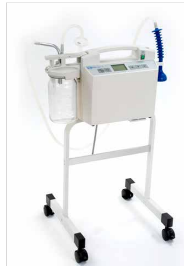
1 Артикул 444.0481.0