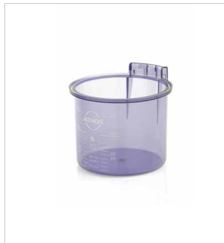
1 Артикул 340.0050.0