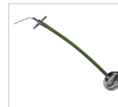
3 Артикул 404.0156.0