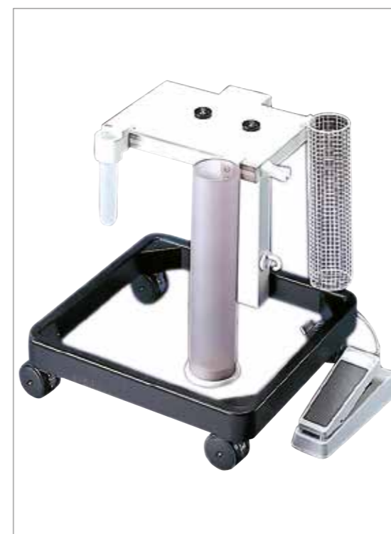
1 Артикул 444.0020.0