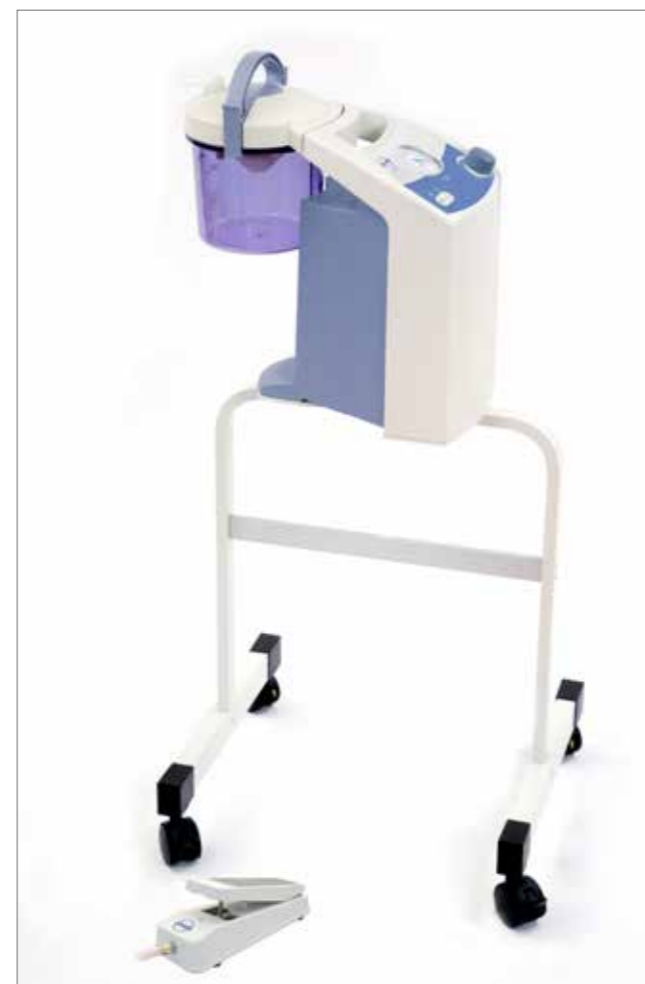
1 Артикул 340.0355.0