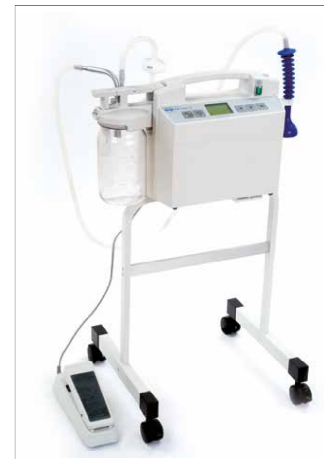
2 Артикул 444.0482.0