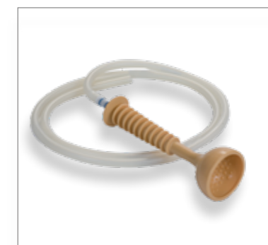
6 Артикул 404.0193.0