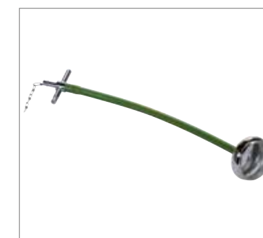
2 Артикул 404.0155.0