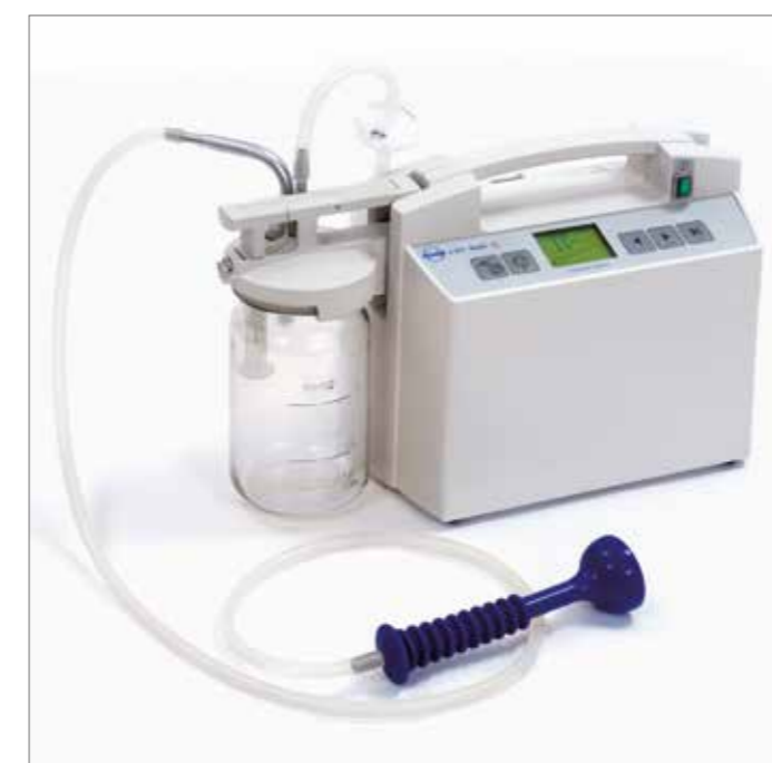
3 Артикул 444.0490.0