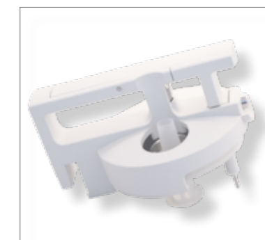
3 Артикул 444.0015.0