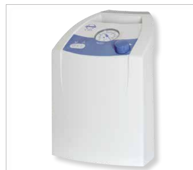
2 Артикул 340.0300.0