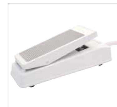
2 Артикул 444.0452.0