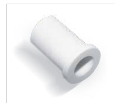
8 Артикул 340.0054.0