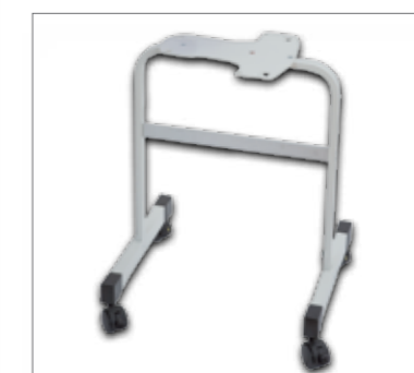
10 Артикул 320.0070.0