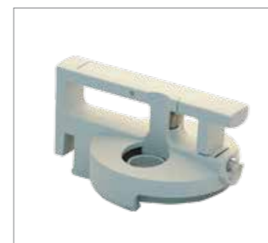
1 Артикул 444.0015.0