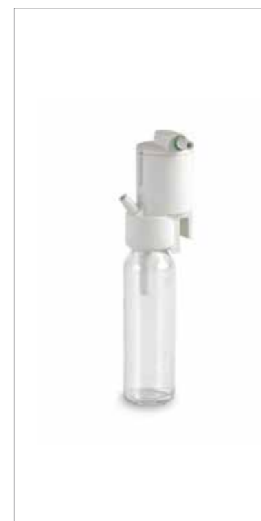
5 Артикул 444.0646.1