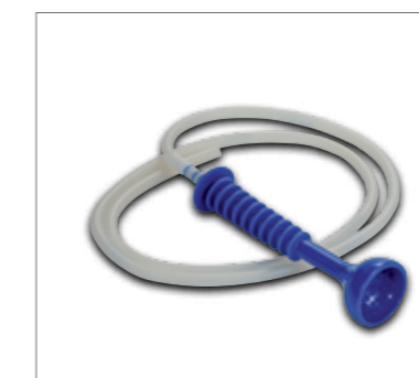
5 Артикул 404.0194.0