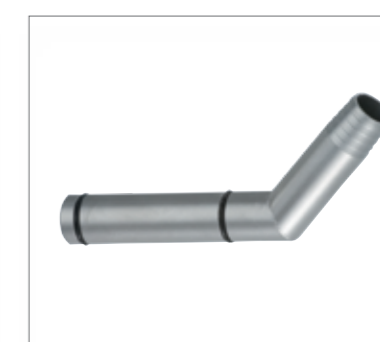
9 Артикул 401.0553.0