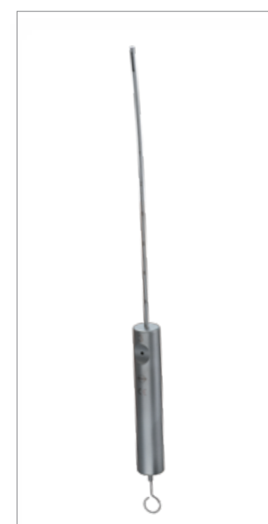
8 Артикул 401.0528.0