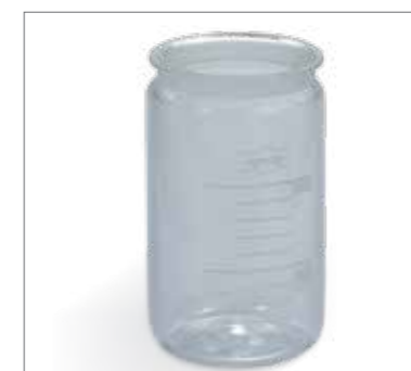
2 Артикул 444.0032.0