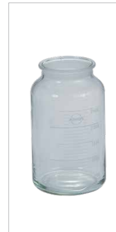
6 Артикул 444.0033.0