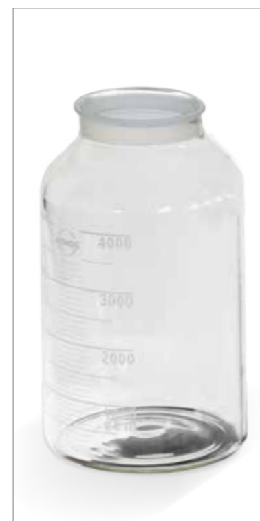
4 Артикул 444.0034.0