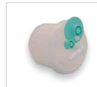
2 Артикул 340.0061.0