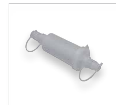
3 Артикул 401.0555.0