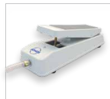
7 Артикул 444.0452.0