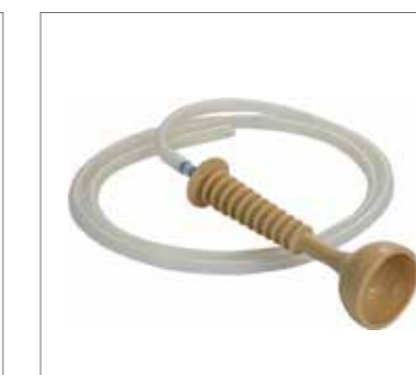
6 Артикул 404.0193.0